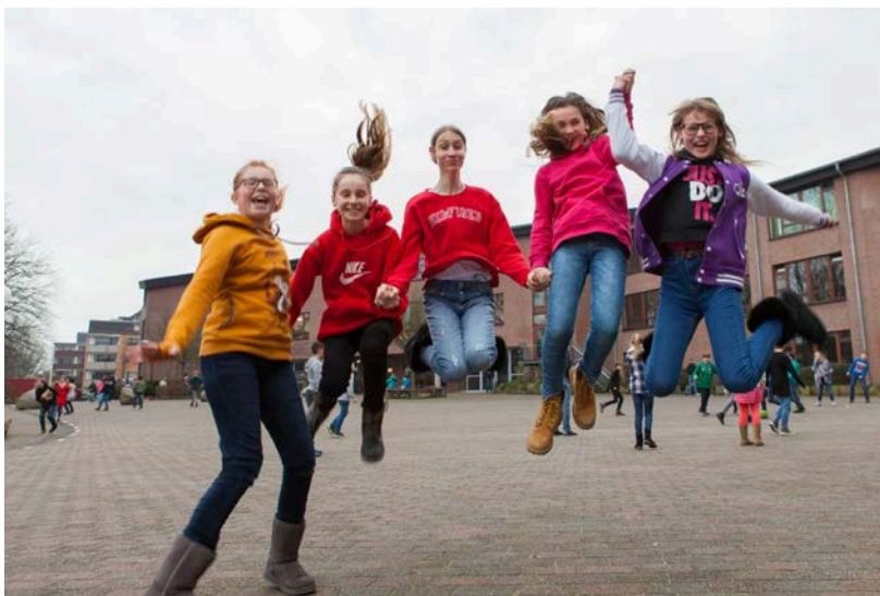
Dieses Foto ist beim Besuch von den mitgereisten Fotografen gemacht worden.