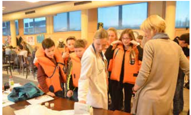
Neben der Begleitung der eigenen Kinder ist auch aktive Begleitung an vielen Stellen in der Schule gefragt. Im Rahmen der Elternmitarbeit beteiligen sich hier z.B. Eltern an der Durchführung der Englisch-Intensivphase.

Hierin liegen Herausforderung und Chance gleichermaßen. Wir als Eltern werden ein Stück weit zum Loslassen gezwungen und die Kinder sind gefordert, die Verantwortung für ihr Lernen selbst zu übernehmen.