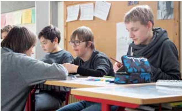
Im gemeinsamen Unterricht wird im Klassenverband gelernt und die Schülerinnen und Schüler bekommen - je nach Bedarf - individuelle Aufgaben und Hilfestellungen.

Durch Angebote auf verschiedenen Niveaustufen können sie ihre Möglichkeiten austesten, so wird die Durchlässigkeit des Systems erhöht.