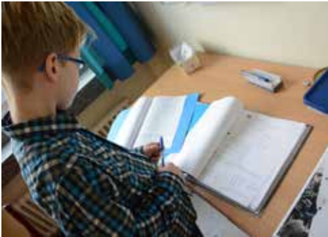
Die Selbstkontrolle nach absolvierten Aufgaben ist im Lernbüro Standard. Alle Bausteine haben Lösungsordner, in denen die Schülerinnen und Schüler ihre Ergebnisse kontrollieren können.

Neben den traditionellen Formen der Leistungsmessung, die in der Regel am Ende einer Unterrichtseinheit/eines Unterrichtsthemas stattfinden und in eine relevante Note münden, fühlen wir uns ebenso den neuen Formen der Leistungsbeurteilung verpflichtet, die es ermöglichen, den Lernenden Rückmeldung zum Lernprozess zu geben und dem Auftrag der individuellen Förderung gerecht zu werden. Die Unterrichtenden unserer Fächer haben dazu für ihr Schulfach Grundsätze und Maßstäbe der Leistungsbeur-