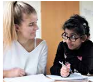
Ältere Schüler als Lernhelfer

fer in Pausenzeiten und bei Veranstaltungen, lassen sich zu Streitschlichtern ausbilden, begleiten als Klassenpaten jüngere Schüler, betreuen die Arbeit im Lernbüro. Schülerinnen und Schüler können sich unter der Überschrift „Tu was“ und als Mitglied der „Bildungsbande“ außerhalb der Schule engagieren. Sie erarbeiten sich Zeit im Unterrichtsalltag, die sie dann an diesen Stellen einsetzen können. So besuchen sie z.B. auch während der Unterrichtszeit alte Menschen oder betreuen in Grundschulen Kinder, die besondere Unterstützung brauchen.