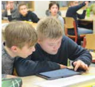
Lernen mit neuen Medien