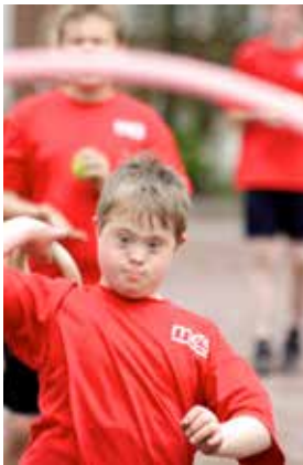
Wie Inklusion gelingen kann, wird immer wieder neu entdeckt - hier ein Beispiel aus dem Sportunterricht.

Im zielgleichen Unterricht erreichen die Schülerinnen und Schüler die Abschlüsse der Gesamtschule und können die Oberstufe besuchen, wenn sie die Berechtigung zum Besuch der gymnasialen Oberstufe erworben haben. Schülerinnen und Schüler, die zieldifferent unterrichtet werden, erreichen die Abschlüsse der jeweiligen Förderschule. Besonders für Schülerinnen und Schüler mit dem Förderbedarf Geistige Entwicklung wurde die an die Klasse 10 anschließende Berufspraxisstufe entwickelt, die theoretische und praktische Lernbausteine sowie Tagespraktika umfasst.