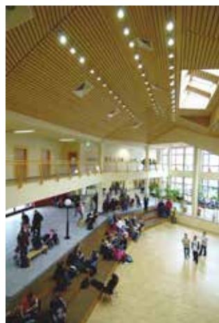
Das Forum der Gesamtschule - Begegnungsort in der Pause und Raum für die großen Feiern

Das Profil der Matthias-Claudius-Schule ist das einer christlich-inklusive Schule, die von Schülerinnen und Schülern, Lehrerinnen und Lehrern und Eltern ganzheitlich gestaltet wird. Wir glauben daran, dass Gott jeden Menschen einzigartig und wertvoll geschaffen und