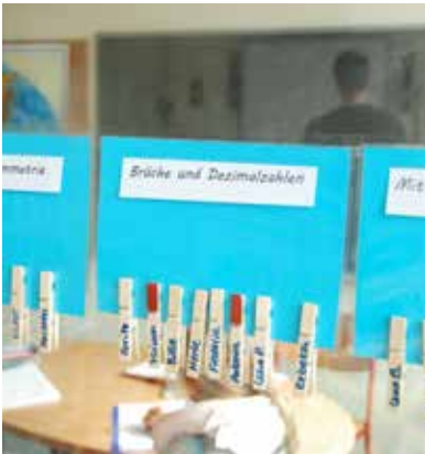
Auch im Lernbüro ist gemeinsame Arbeit möglich. In einigen Klassen markieren die Schüler die Bausteine, an denen sie arbeiten und machen so gegenseitige Hilfe möglich.