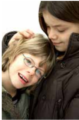
Gegenseitige Unterstützung ist Bestandteil des gemeinsamen Lernens.

Neben dem Gemeinsamen Lernen in innerer Differenzierung mit Materialien, die auf die Schülerinnen und die Schüler mit Förderbedarf zugeschnitten sind, bietet die MCS vor allem für Schülerinnen und Schüler mit dem Förderbedarf Lernen und Geistige Entwicklung auch Unterricht in Kleingruppen, klassenübergreifenden Lerngruppen, Vorhaben und Projekttagen an.