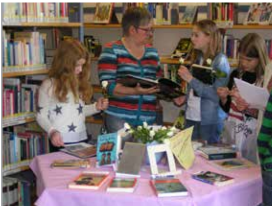
Auch die große Schülerbibliothek steht für Unterricht zur Verfügung. Hier können Schülerinnen und Schüler Bücher und andere Medien ausleihen und recherchieren. Regelmäßig finden Veranstaltungen, wie z.B. Lesungen statt.

entwickeln in praxisorientierten Projekten fächerübergreifend eigene Fragestellungen und Lösungswege. Als Ergebnis der Arbeit entsteht ein vorzeigbares Produkt. So werden während der Arbeit in den Projekten nicht nur die im Lernbüro erworbenen Kompetenzen, sondern auch alle Sinne in besonderem Maße einbezogen.