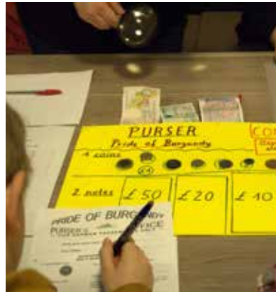
Beim handlungsorientierten Stationslauf „A Trip to Britain“ in der als Fähre umgestalteten Mensa haben die Schüler/innen der Jahrgangsstufe 6 als „Passagiere“ bei der Station Zahlmeister („Purser“) die Aufgabe, echtes britisches Geld unter die Lupe zu nehmen und einen Fragebogen auszufüllen.